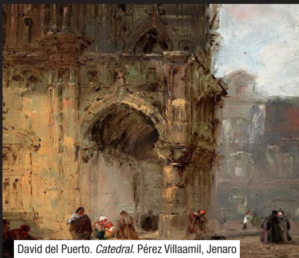
David del Puerto. Catedral . Pérez Villaamil, Jenaro