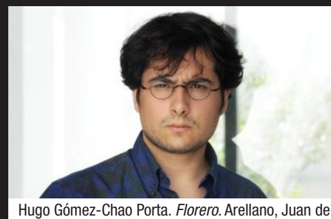
Hugo Gómez-Chao Porta. Florero . Arellano, Juan de