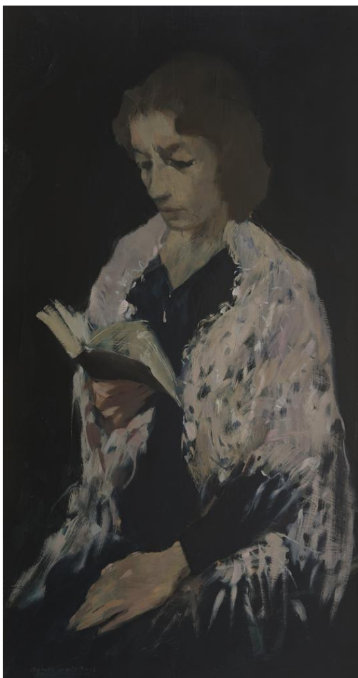
Blanca 1972 Óleo / tablex Colección particular