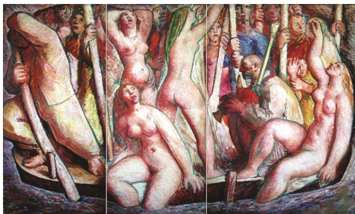
La barca de Caronte.

Tríptico, óleo s/lienzo, 1955 (172 x 288 cm)