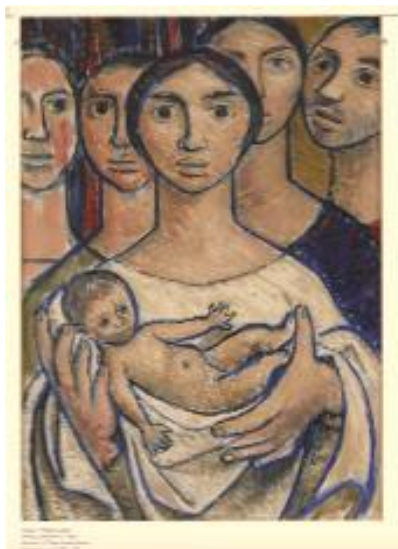
Maternidad 1963, Óleo s/lienzo (65x43 cm) Fundación María José Jove