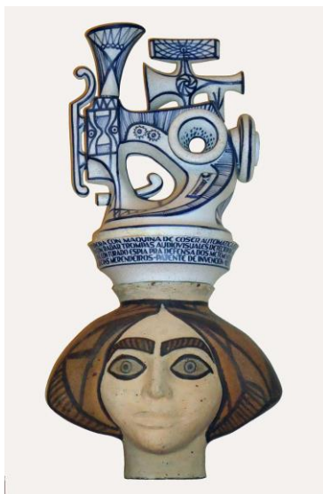
Costureira con máquina de coser. automática, trompas audiovisuales, detector de mentiras y con agujereado espía para defensa de los metementodo y de los perros merendeiros - patente de invención 1972-1973 1973, Porcelana y gres (72 cm/alto) Colección particular