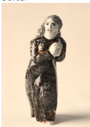
María Magdalena 1958, Porcelana (20 cm/alto) Colección particular