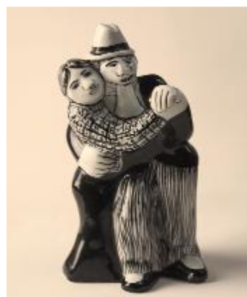
Bailadores tangueros Ca. 1959, Porcelana (18 cm/alto) Colección particular