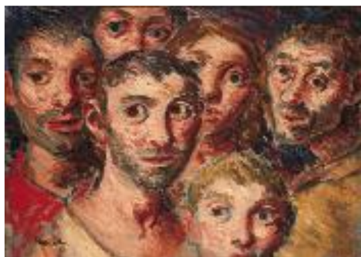
Xentes que ollan vir algo