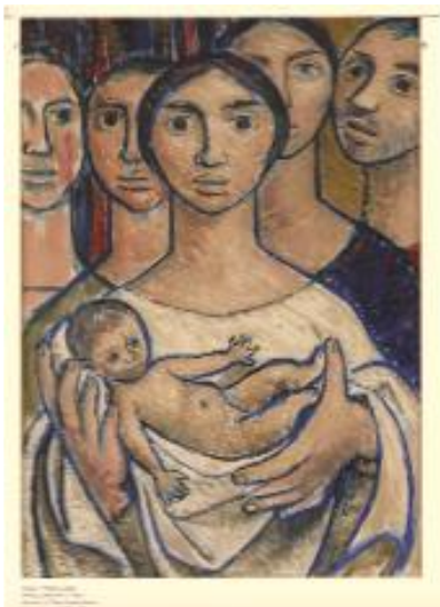
Maternidade 1963, Óleo s/lenzo (65x43 cm) Fundación María José Jove